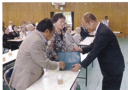
▲敬老会にて金婚祝い品の贈呈(麻郷地域)

本事業は、敬愛の推進を目的に町の行事である敬老会に、町内8会場(麻郷・城南・麻里府・東田布施・西田布施・小行司・国木・竹尾)の区域に分かれ、それぞれ地域の75歳以上の方を招待し、敬老の日を楽しく過ごして頂くために、婦人会の総力をあげてお世話をさせて頂いております。お食事の準備、演芸会を開くなど一生懸命のおもてなしをいたします。年間を通じて地域のお年寄り、特に独居の方等には友愛訪問等も行っています。