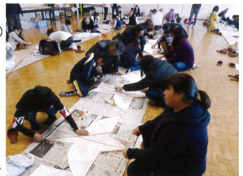
▲親子ふれあい凧づくり教室 (町子ども会育成連絡協議会)