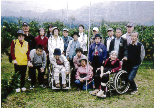
▲周防大島町にて家族そろってみかん狩り (町心身障害者協議会)