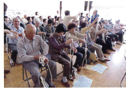
▲防災・減災講習会 (町ボランティア連絡協議会)