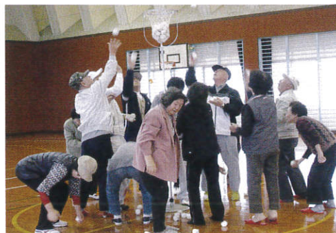
▲レクリエーション大会～玉入れ～ (町老人クラブ連合会)

本事業の目的は、町内の高齢者の仲間づくりや出会いの場づくりを主としていますが、高齢者の自然な見守りもでき、認知症、介護予防的な効果もあります。地域の高齢者が集会所等に集まり、内容は、保健師による健康体操や血圧測定、ビンゴゲーム等の各種レクリエーションを楽しみます。民生委員さんや福祉員さん、自治会長さん、その他ボランティアの方々が熱心にお世話をされておられます。