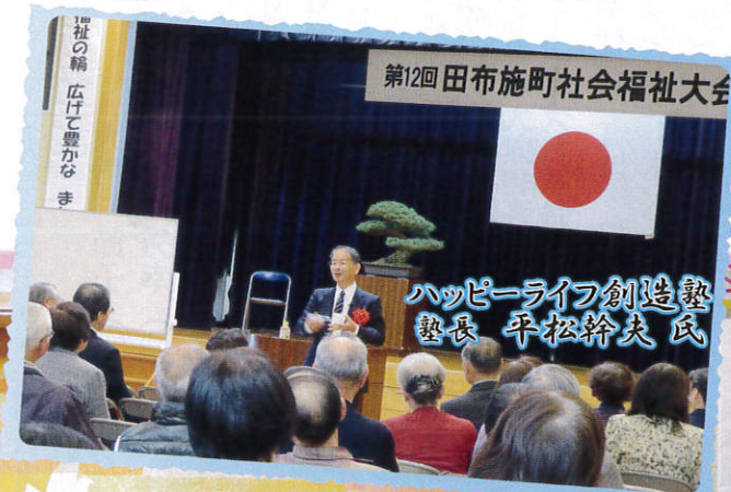
第12回 田布施町社会福祉大会