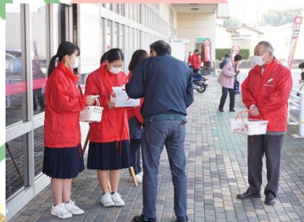
マックスバリュ田布施店にて (12/3)

今日の募金活動で募金がどのように使われているか、どんな表情で行えばよいかわかりました。募金活動は初めてだったけど、しっかり声を出してすることができました。また、募金をたくさんの人にしてもらってうれしかったです。これからは募金活動を行っているひとがいれば協力し合いたいと思います。