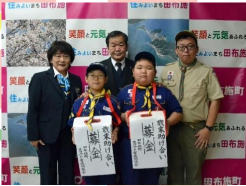
田布施町スカウト育成協議会 様 (12/26)

田布施地域交流館とマックスバリュ田布施店とマルキュウ田布施店で実施した街頭募金は、田布施中学校生徒会、共同募金配分団体、田布施町ボランティア連絡協議会の方々にご協力いただきました。