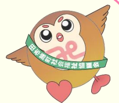
田布施町社協 マスコットキャラクター 「たぶすけ」