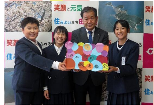
麻郷小学校 様 (12/8)