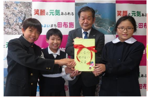
田布施西小学校 様 (12/8)