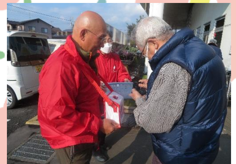
田布施地域交流館にて (12/3)