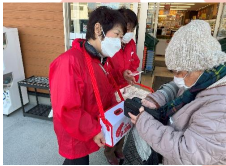
マルキュウ田布施店にて (12/3)