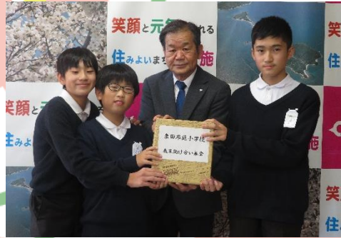
東田布施小学校 様 (12/8)