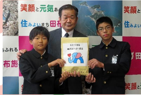
城南小学校 様 (12/7)