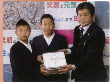
▲12/13 麻郷小学校 様