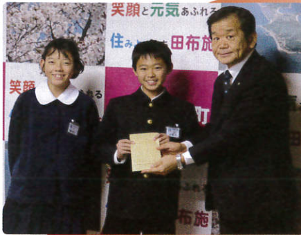
▲12/18 田布施西小学校 様