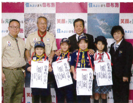
▲12/25 田布施町スカウト育成協議会 様