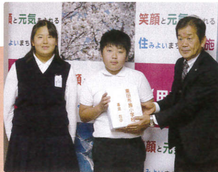
▲12/7 東田布施小学校 様