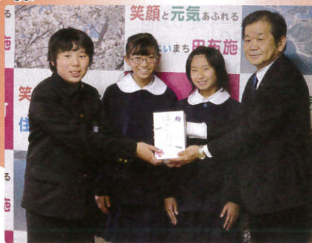
▲12/17 城南小学校 様