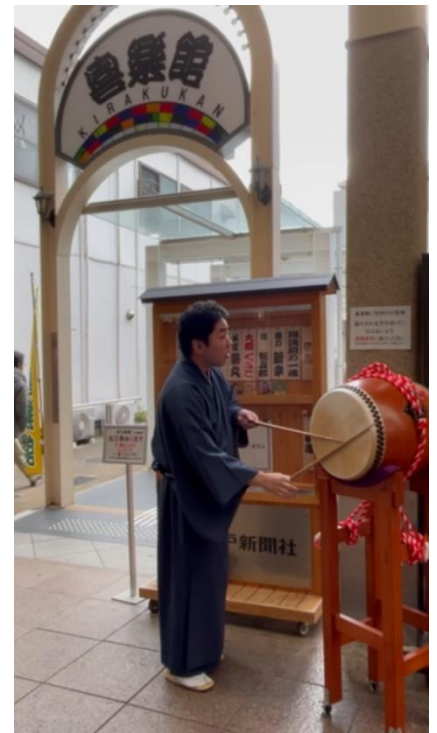
一番太鼓 バチで“入”の字