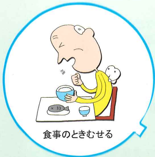
食事のときむせる