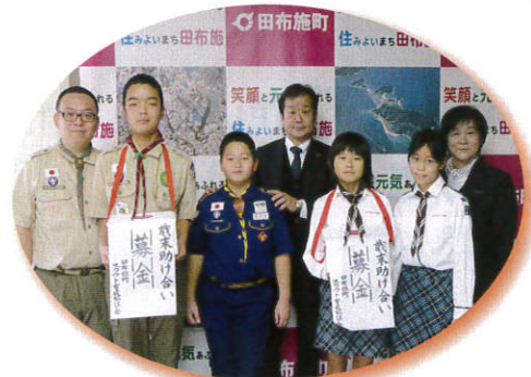
▲12/25 田布施町スカウト育成協議会 様