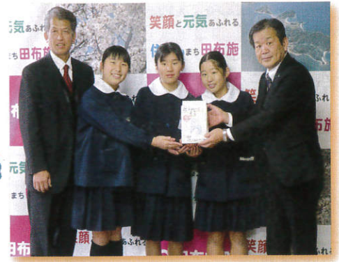
▲12/11 城南小学校 様