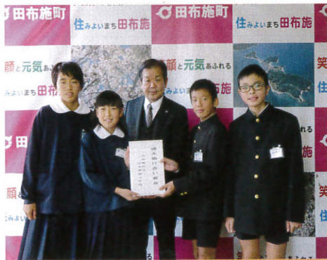
▲12/13 田布施西小学校 様