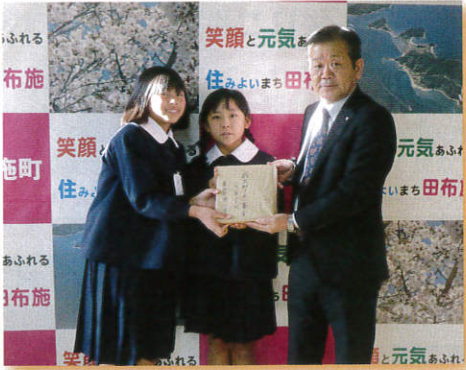
▲12/9 東田布施小学校 様