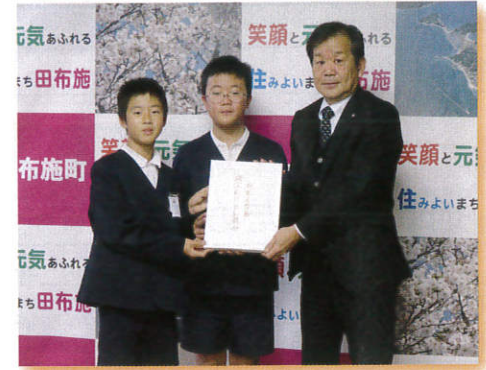
▲12/17 麻郷小学校 様