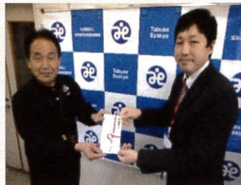
▶山口県東部ヤクルト販売㈱様 令和3年11月15日(月)