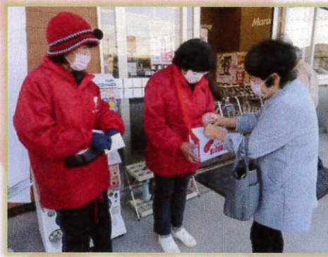
▲ マルキュウ田布施店にて (12/5)