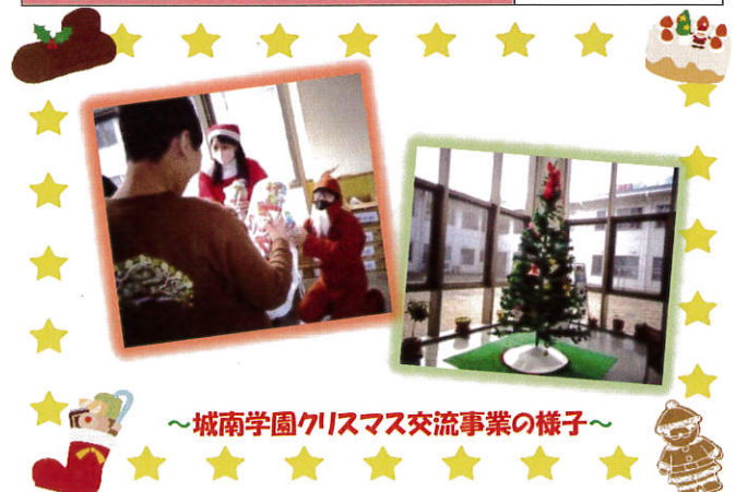
～城南学園クリスマス交流事業の様子～

(注1)若くても病気等のため、お一人でお正月を迎えられる人等 (注2)各地区の民生委員さんにご協力いただき、歳末(大晦日)をお一人、あるいは夫婦のみで過ごされる高齢者の方へ「おせち料理」をお配りしました。