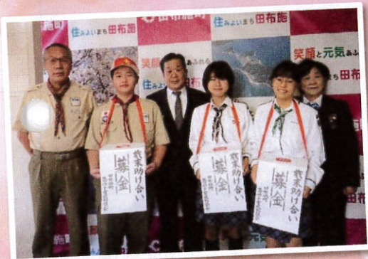
▲ 田布施町スカウト育成協議会 様(12/27)

マルキュウ田布施店と田布施地域交流館で実施した街頭募金は、田布施中学校生徒会、共同募金配分団体、田布施町ボランティア連絡協議会の方々にご協力いただきました。