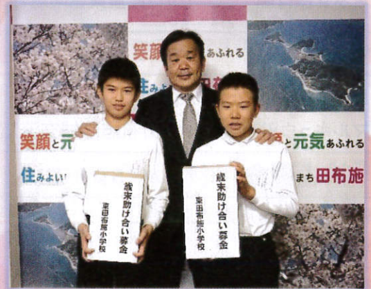
▲ 東田布施小学校 様 (12/16)