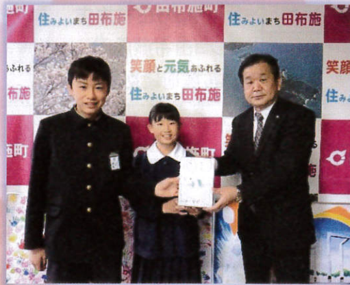
▲ 城南小学校 様 (12/3)