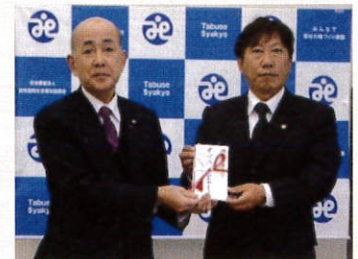
▶田布施ライオンズクラブ様 令和3年11月25日(木)