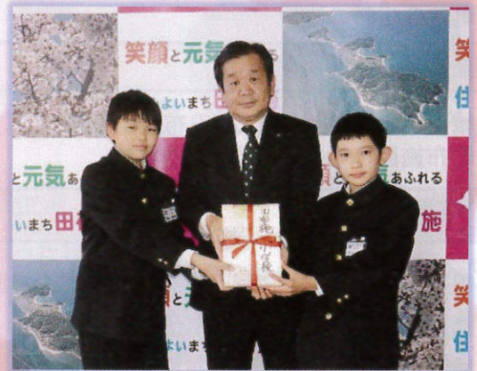
▲ 田布施西小学校 様 (12/14)