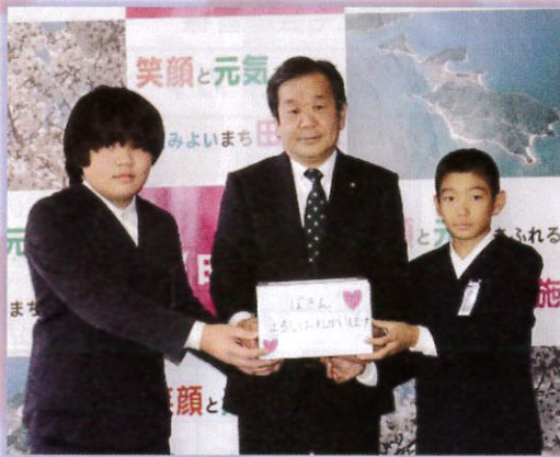
▲ 麻郷小学校 様 (12/14)