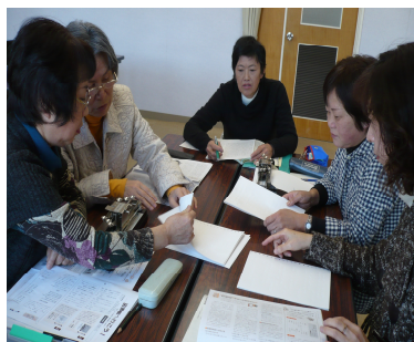
広報「たぶせ」の点訳の編集中： 点訳「ほおずきの会」