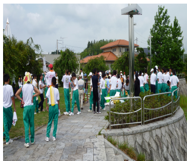
小・中学生 夏休み環境美化ボランティア