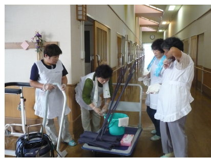
「たぶせ苑」での清掃作業！気分も さわやか！：「ひまわりの会」