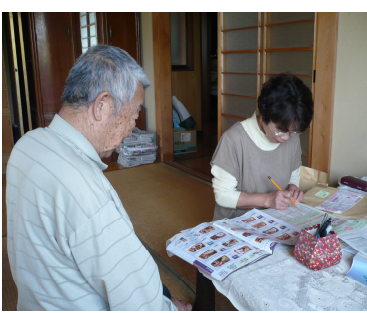
「何が好き？」 独居高齢者の配食注文票を書く話し相手ボランティア