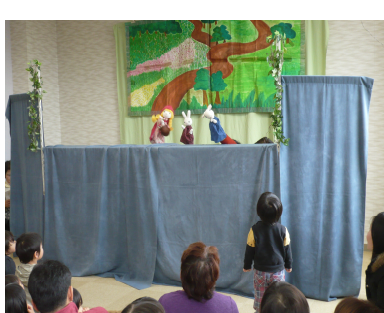
図書館まつりにて「もやいの会」の人形劇上演中!