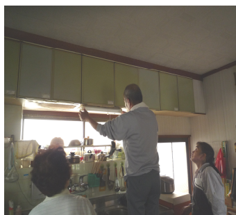
手仕事ボランティア「助っ人マ ン」が蛍光灯の修理