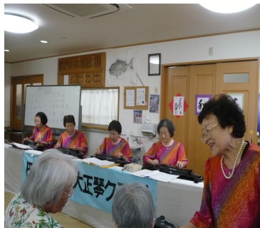
琴の調べで施設訪問: 琴昇流大正琴たぶせボランティアクラブ