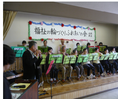
「ふれあいの会」にて、手作りの竹楽器で演奏会: たぶせ竹楽坊