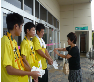
24時間テレビ募金活動 : 田布施農工高校