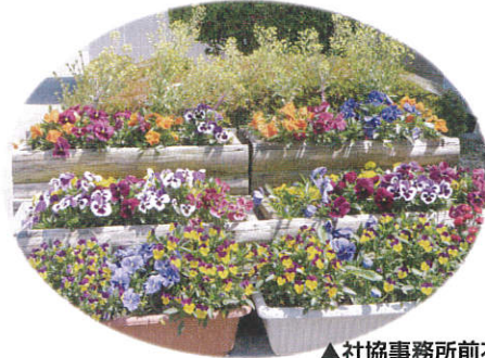
▲社協事務所前花壇