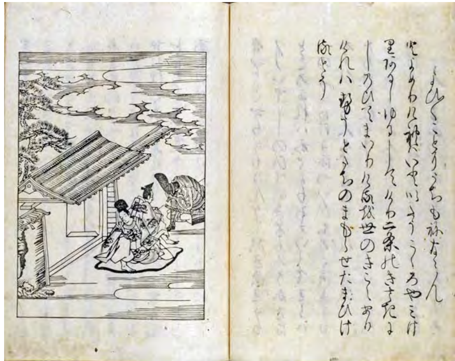
嵯峨本『伊勢物語』から。絵は木版で印刷、文字はこれで活字である

とくに漢籍や医書に加え、 仮名入の物語 や国史の書物まで刊行されるようになったことに大きな意義があった。『源氏物語』『徒然草』『平家物語』『太平記』などが印刷されたのは活字版が最初である。しかも人気だった。読者層も学僧から公家や上流の武家に広がった。中世のお伽草子もいくつかはこのとき初めて印刷された。