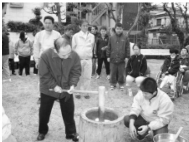
2007年1月 福祉もちつきをつどい ふじみ園にて

川崎労福協は、パートナーシップの諸活動（文化サロンやコンサート）などの活用とともに、労福協会員・勤労者の立場でパートナーシップの活動に意見反映できればと考えています。