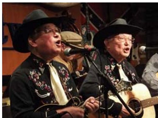
2012-03-03 in Fortworth

なお、直接ライブハウスへ予約される場合には、親鴨会とお伝えください。出来るだけ同じ場所の席を確保してもらいます。