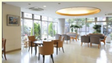
エスペラル城東1階ホール

城東医誠会クリニックは、介護付き有料老人ホーム「エスペラル城東」に併設しています。