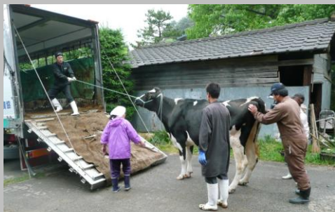
牛は飼えなくなり、酪農家はみな廃業に追い込まれた。